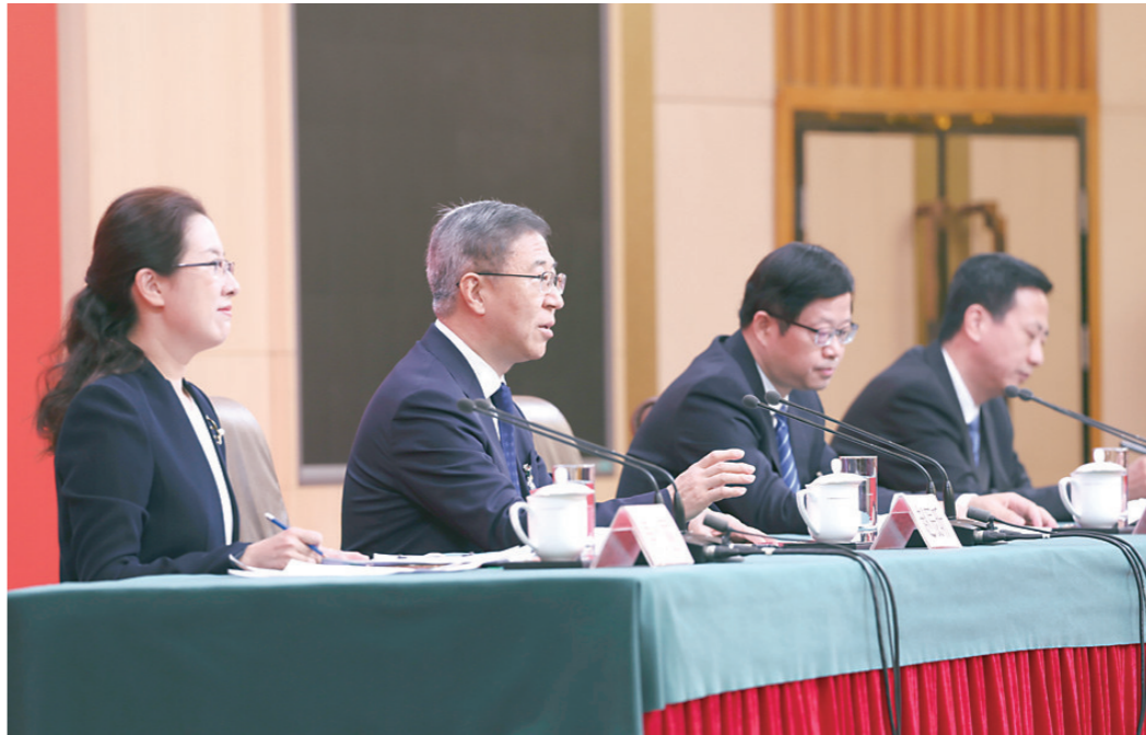
▲党的二十大大新闻中心17日上午举行第一场记者招待会。

新华社北京10月17日电 党的二十大大新闻中心17日上午举行第一场记者招待会，国家发展改革委党组成员、副主任赵辰昕，国家发展改革委党组成员、国家粮食和物资储备局党组书记、局长丛亮，国家能源局党组成员、副局长任京东