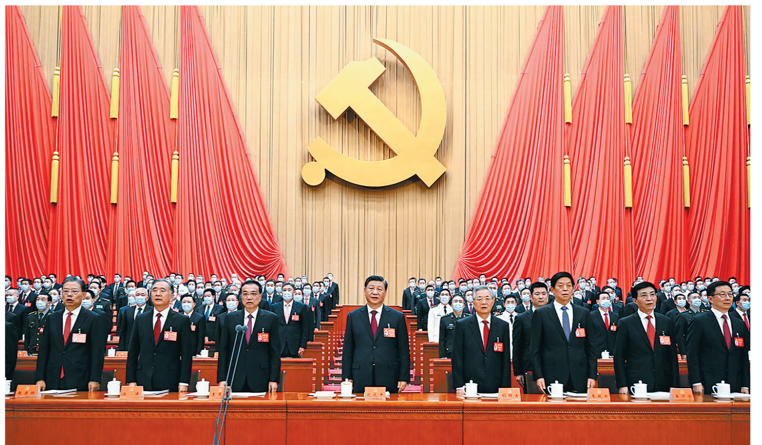
10月16日，中国共产党第二十次全国代表大会在北京人民大会堂开幕。习近平代表第十九届中央委员会向大会作报告。