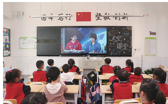
▲市中附二小组织收看“天宫课堂”。