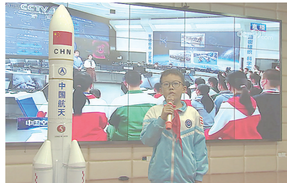
▲南方三小的同学分享了自己的学习感悟。