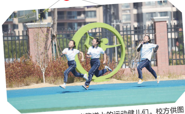
女子百米跑道上的运动健儿们。