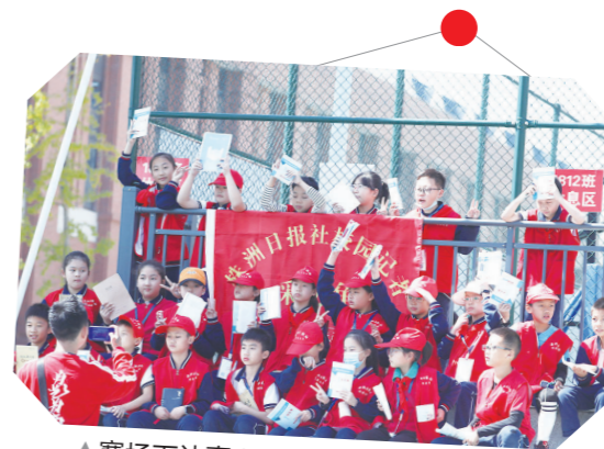
赛场下认真观看比赛的校园记者。

同时,在校运动会的前一天10月13日,是属于全国少先队员共同的节日——中国少年先锋队建队纪念日。你还记得队旗、队徽、队礼的含义吗?今天,让我们一起聆听新队员的入队心声!