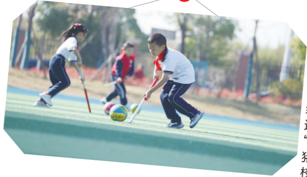
一、二年级的趣味运动项目“赶金猪”。