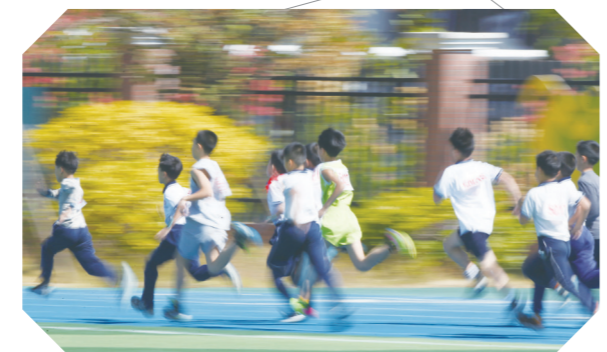
激烈角逐的跑步赛场。