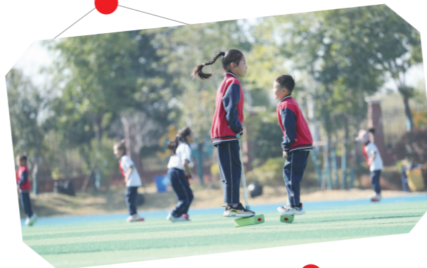
一、二年级的趣味运动项目“跳跳”。