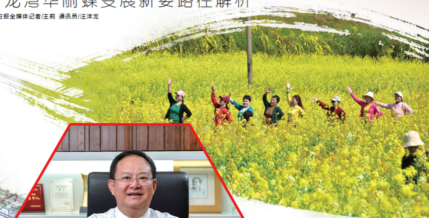
▲青龙湾油菜花节市民打卡拍照。

多年来，区域名称在变，山与水在变，路与城在变，构建的是高质量、跨越式发展的“渌口格局”。作为城乡一体化的典范，渌口区青龙湾通过实施“城乡一体化、标准国际化、居住田园化”的发展理念，城市功能完善，区位优势独特，生态环境优良，产业基础坚实，已经蜕变成全国“城乡一体化发展”的生动样板，区域发展迎来华丽蝶变。