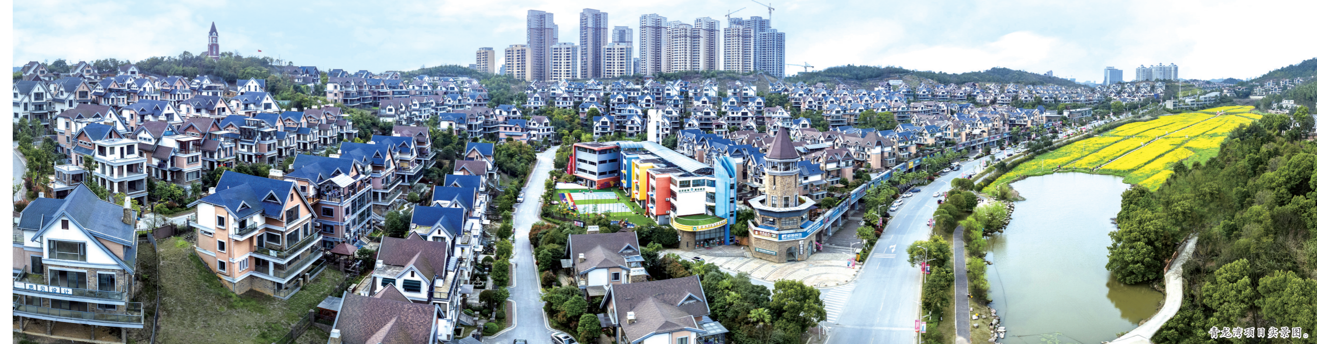
▲青龙湾项目实景图。

地址：株洲市青龙湾第五代建筑营销会所 电话：0731-22109999/8888