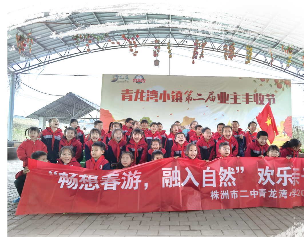
▲青龙湾小镇第二届业主丰收节。