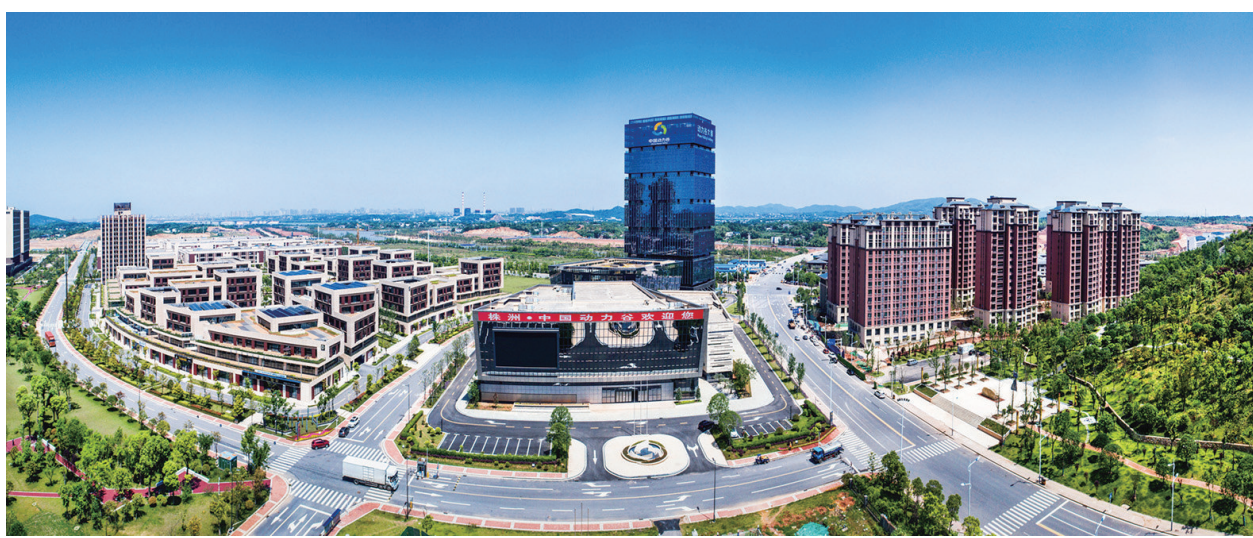
中国动力谷自主创新园。

创新是这个时代的命题。当大众创业、万众创新成为席卷全国的浪潮，株洲高新区中国动力谷自主创新园勇立时代潮头，激荡创新活力，踏波而歌，逐浪前行。