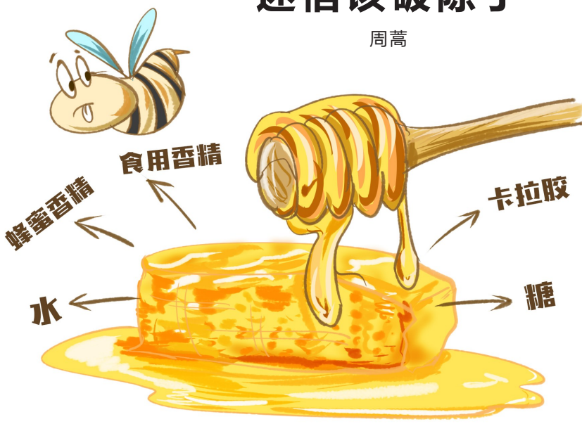
“海克斯”科技蜂蜜。漫画/左骏