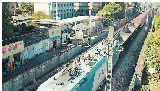
站人行天桥,看到车缓缓驶过。

2017年开始打造。目前,有50亩花地,鲜花品种主要为百日草、硫华菊、波斯菊、柳叶马鞭草和千屈菜。市民前往赏花,还可品尝到当地村民栽种的“九郎福柚”。