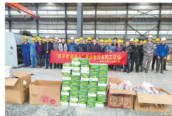
▲涠口区“庆丰收·迎盛会”走访慰问农民工活动现场。通讯员供图

本报讯(株洲晚报融媒体记者/何春林 通讯员/罗萍)10月9日,涠口区开展“庆丰收·迎盛会”走访慰问农民工活动。慰问过程中,该区发放了200份慰问物资,包括墨鱼、木耳、桂圆干、牛奶等。