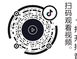
扫码观看视频。打开抖音

10月9日,9名落水被救者集中向株洲湘江义务救援协会送锦旗。据悉,该协会今年以来在湘江株洲城区段已救援15名落水市民。这支救援队伍成立12年以来,共在湘江救援134人。协会巡逻时间是下午4点到晚上10点,巡逻的范围是四桥钢琴广场至一桥水域。