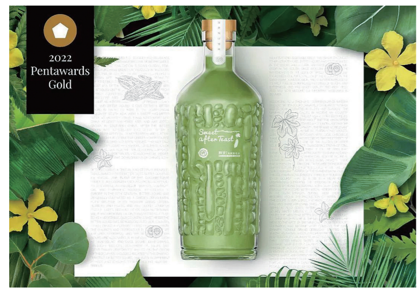
▲2022年国际Pentawards竞赛金奖作品《回甘苦瓜汁》。

据了解,Pentawards是全球首个也是唯一的专注于各种包装设计的竞赛,在包装设计界具有极高的权威,被视为全球包装设计领域中最有声誉的专属竞赛,又被称为“设计界奥斯卡”,以评选标准苛刻著称,代表着该领域全球最出色的设计水平。