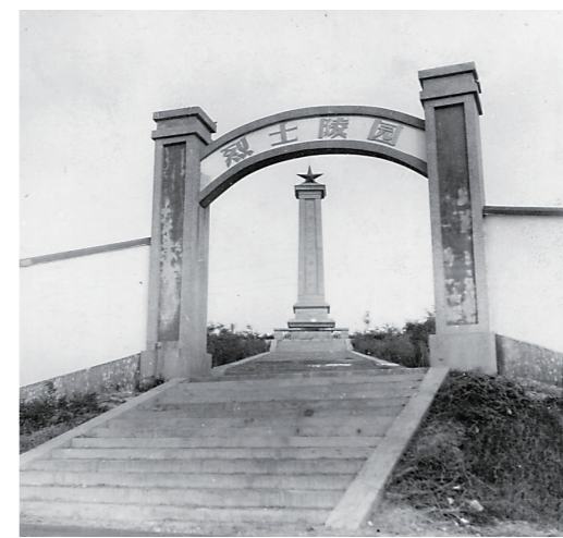
▲醴陵烈士陵园旧址。

在醴陵烈士陵园旧址，小小的山坡上有一处独一无二战马冢。“可惜的是，战马冢的墓碑上未能留有任何史记资料，我们查询了醴陵县志也无任何收获。但不能否定的是，这些战马曾经同样为共和国征战沙场，并付出鲜血与生命。”醴陵烈士陵园相关负责人介绍。