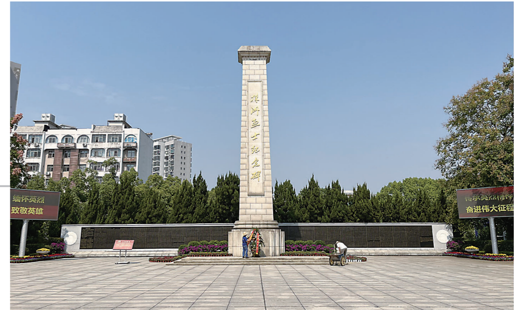
▲9月28日，株洲烈士纪念园，工作人员摆放花篮。

英雄是民族最闪亮的坐标。从一叶红船到巍巍巨轮，从星星之火到燎原之势，一代代先烈前仆后继。每一次致敬英烈，是对初心的叩问，也是对精神的唤醒。