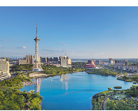
旅游环境优美舒适的神农城景区。

株洲日报讯(全媒体通讯员/吴思思) 近日,由天易公司旗下子公司——株洲神农城文化旅游发展有限公司负责运营管理的神农城景区,顺利通过了国家4A级旅游景区质量等级复验。