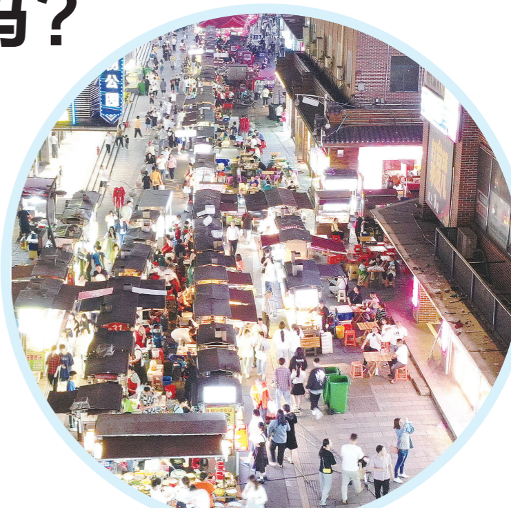
形成美食特色的钟鼓岭夜市。记者/谢慧 摄(资料图)

近年来,国家层面明确提出转变城市发展方式,包括长沙、重庆、西安在内的这些“顶流”都先后开展了城市“网红化”转型。城市“红不红”,与经济总量、城市规模等“硬件”息息相关,也考验着城市形象塑造和推广的功课水平。事实上,网红城市已不再是单一流量的体现,而是城市知名度和竞争力的综合呈现。从长期而言,打造网红城市和追求城市高质量发展,本质上一致的。