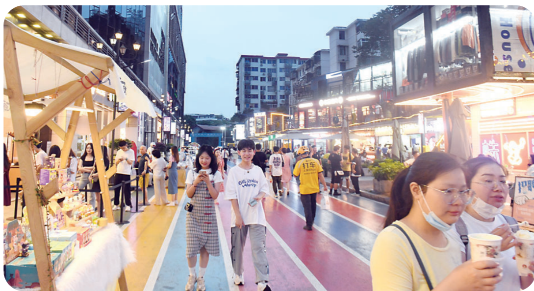
希尔顿JOJO街人流如织,这里是株洲年轻人夜生活的网红打卡点。记者/谢慧 摄(资料图)