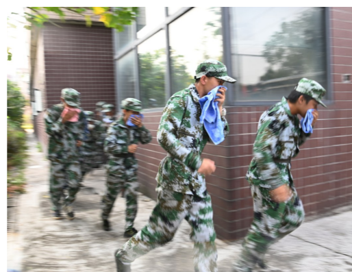
图为学生在有序疏散。