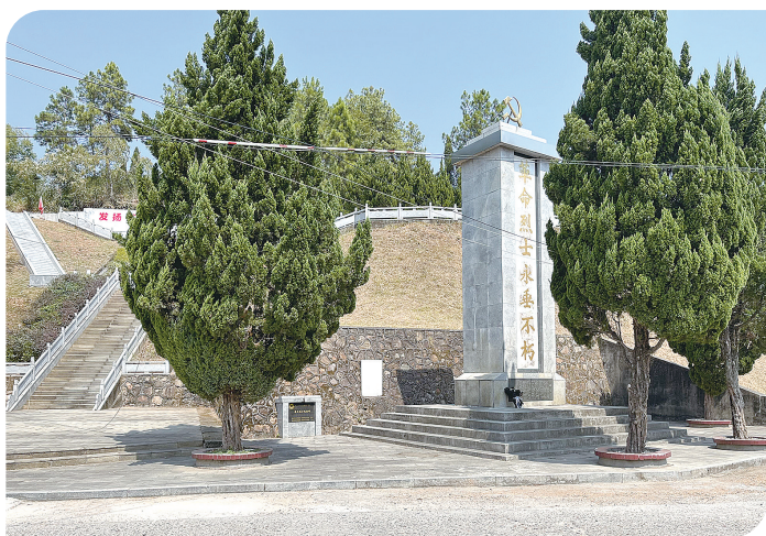
渌口镇关王村，为悼念牺牲在关王坝240余名革命烈士所建的纪念碑。