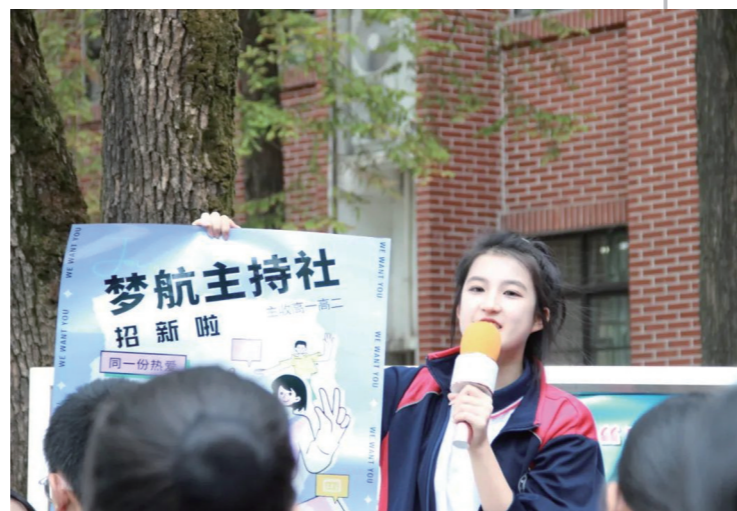
9月23日,株洲市八中2022年社团招新大会如期举行。为吸引更多同学的加入,各社团纷纷拿出了各自的“看家本领”,出奇招、拼智慧,各显其能、张扬创意。