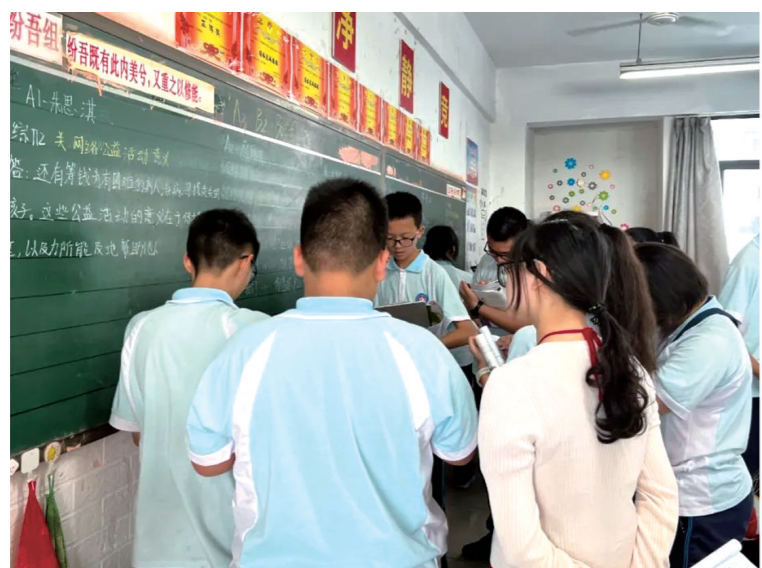
▲政治组老师深入到各个小组的讨论中。

本报讯(株洲晚报融媒体记者/宋芋璇 通讯员/罗敏)开学之际,景弘中学的一节政治课堂上,竟然出现了9位老师同时给学生指导学习的场景,这是什么特别的课堂?