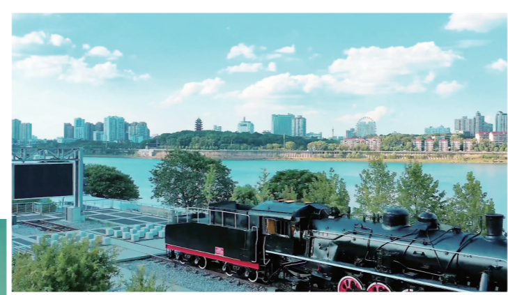
▲湘江风光带