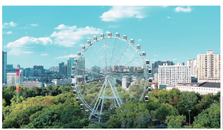
▲神农公园摩天轮