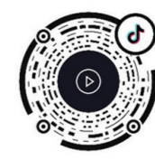
▲打开抖音 扫码观看视频。

9月24日晚,攸县传统民俗“打铁水”在酒仙湖畔精彩上演。滚烫的铁水抛洒夜空,发出绚丽夺目的光彩,令观众叹为观止,回放视频更浪漫。据悉,“攸县打铁水”起源于明末清初,鼎盛于清代至新中国成立初期,至今已有300多年历史。