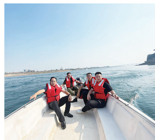
▲冲锋舟下水,“零距离”巡河现场。

本报讯(株洲晚报融媒体记者/杨如 通讯员/黄晓敏 文钦)“现在河流问题越来越隐蔽了,不练就‘火眼金睛’的本领,还真发现不了。”9月26日,天元区雷打石镇河长办和生态环境办工作人员,从白沙洲渡口下水,乘坐冲锋舟溯流而上,直达七桥,对湘江雷打石镇段水域开展日常巡河工作。