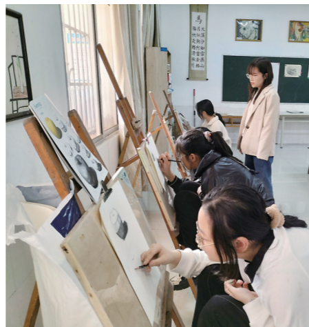
▲群丰镇乡村复兴少年宫里的绘画课。

本报讯(株洲晚报融媒体记者/谭昕吾 通讯员/齐赛 唐子斐)最近,天元区在辖区群丰镇、三门镇、雷打石镇三地积极推进乡村“复兴少年宫”建设,着力培养农村少年儿童广泛的兴趣爱好,让乡村少年享受和城区孩子一样丰富多彩的课外活动。