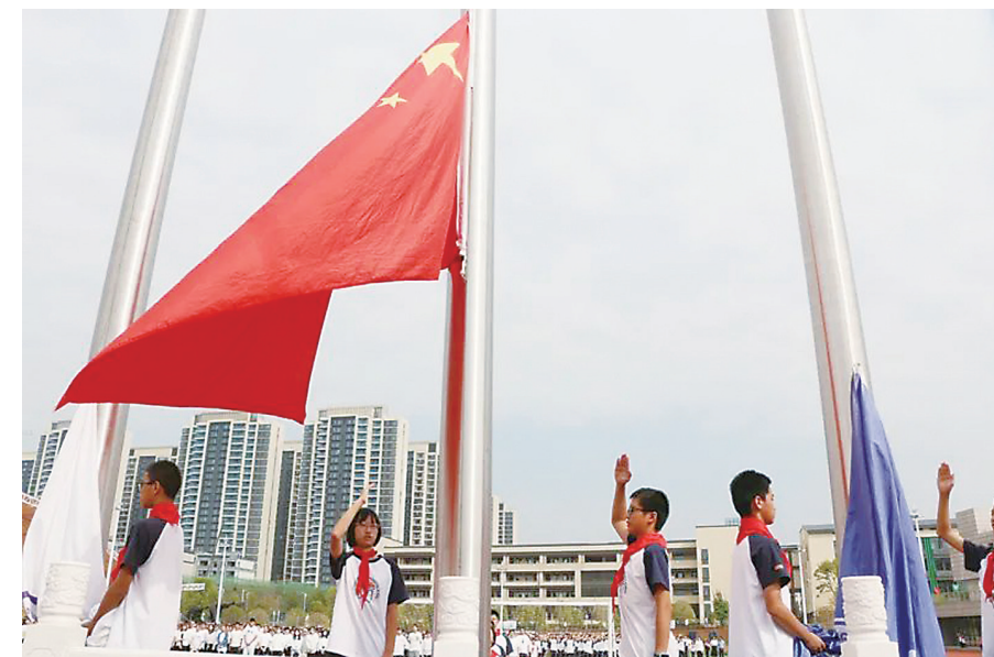
▲鲜艳的五星红旗冉冉升起,孩子们向国旗敬礼。