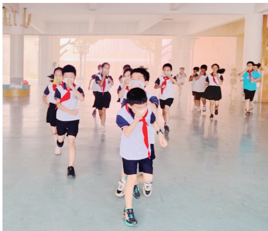
▲烟雾中，同学们迅速撤离。

本报讯(株洲晚报融媒体记者/戴凇 通讯员/易晓鹏)加强学校消防安全工作，提升广大教师及学生的消防安全意识，提高师生防灾及突发事件应急处理能力。9月20日上午，市二中枫溪学校小学部西校区举行消防疏散演习和安全教育活动。