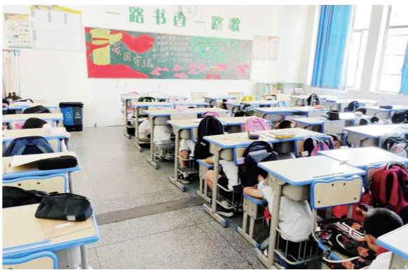
▲同学们迅速躲避到座位下。

老师们认为，通过此次“一呼百应”演习活动，有效地增强了学校全体师生的安全意识和反恐防暴意识，掌握了险情发生后