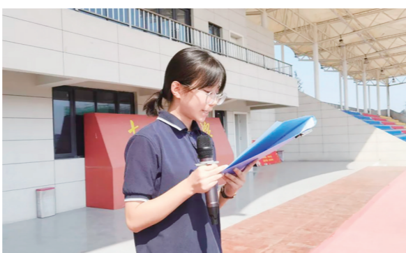
▲学生代表倡议同学们树立食品安全意识。

据悉，为加强食品安全宣传，学校召开了相关主题班会，向学生普及假冒伪劣食品、“三无”产品及过期食品的危害及鉴别