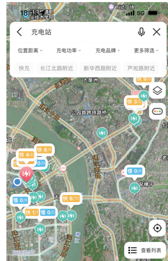
▲通过高德地图可查询我市充电桩分布及使用情况。记者/张威 制图