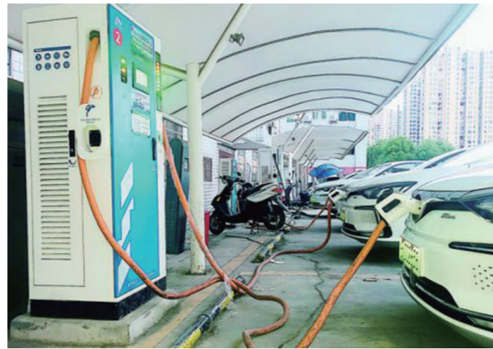
▲湖南工业大学西街充电站使用率高。