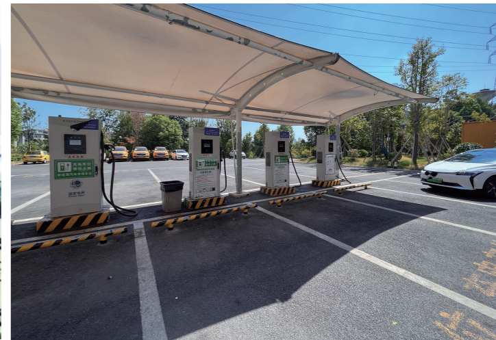
▲临近中午,荷塘区文化路附近的充电站暂无人使用。