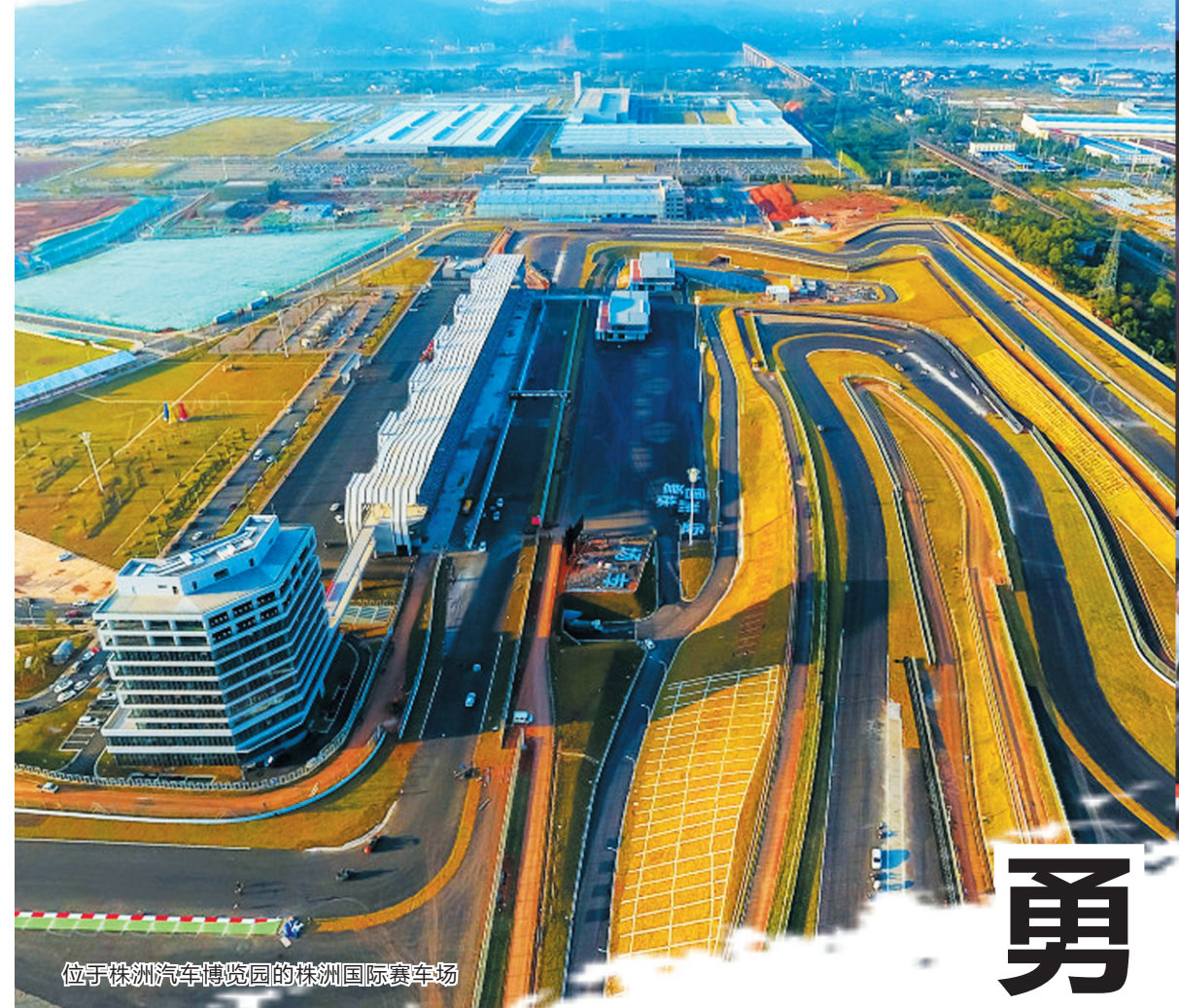
位于株洲经开区(天元区)的株洲国际赛车场