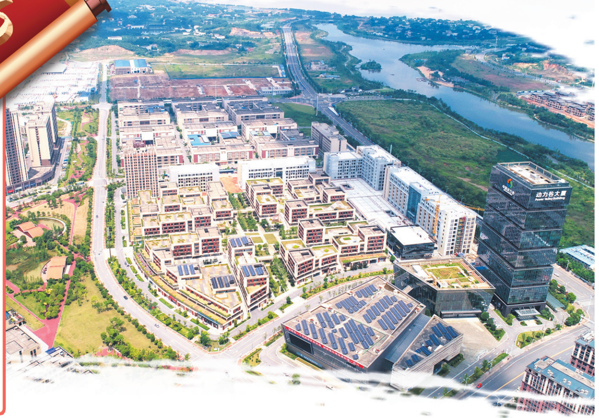
▲株洲高新区(天元区)园区鸟瞰图