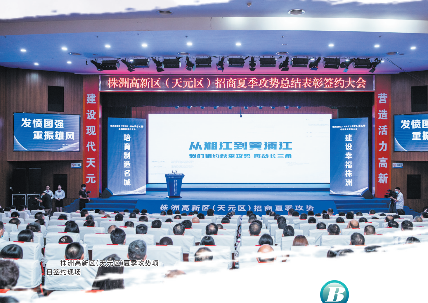
株洲高新区(天元区)招商夏季攻势项目签约现场