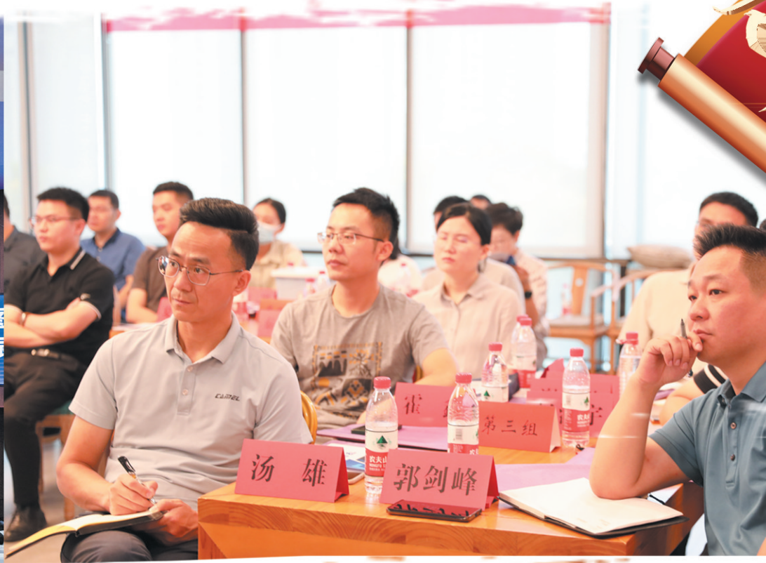
▲高新区(天元区)以招商为契机,全力提升干部能力。图为招商夏季攻势培训现场。