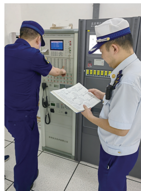
消防监督员在抽查场所消防控制室运行情况。

视,最终会酿成事故。”临近晚上11点,曹慧明和同事回到办公室,“要把今晚的检查情况赶紧整理出来,列入回头看的清单。”