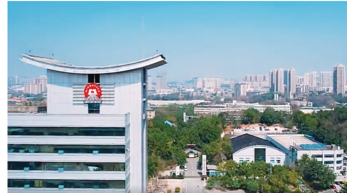
株洲硬质合金集团有限公司。

瞄准硬材料,锻造“硬”实力。作为株洲先进硬材料产业核心区,荷塘区靶向发力,全力打造材料科技城,快速集聚以先进硬材料、钢铁材料、智能建筑材料、复合新材料为主的4个“园中园”,争创千亿产业集群。