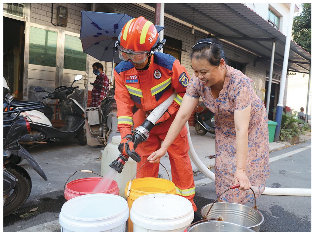
消防队员用水枪为居民打水。

下一步,各消防部门将继续与各乡镇保持联系,建立需求信息快速沟通渠道,针对当地村民的饮用水消耗情况,及时给予输送补充。