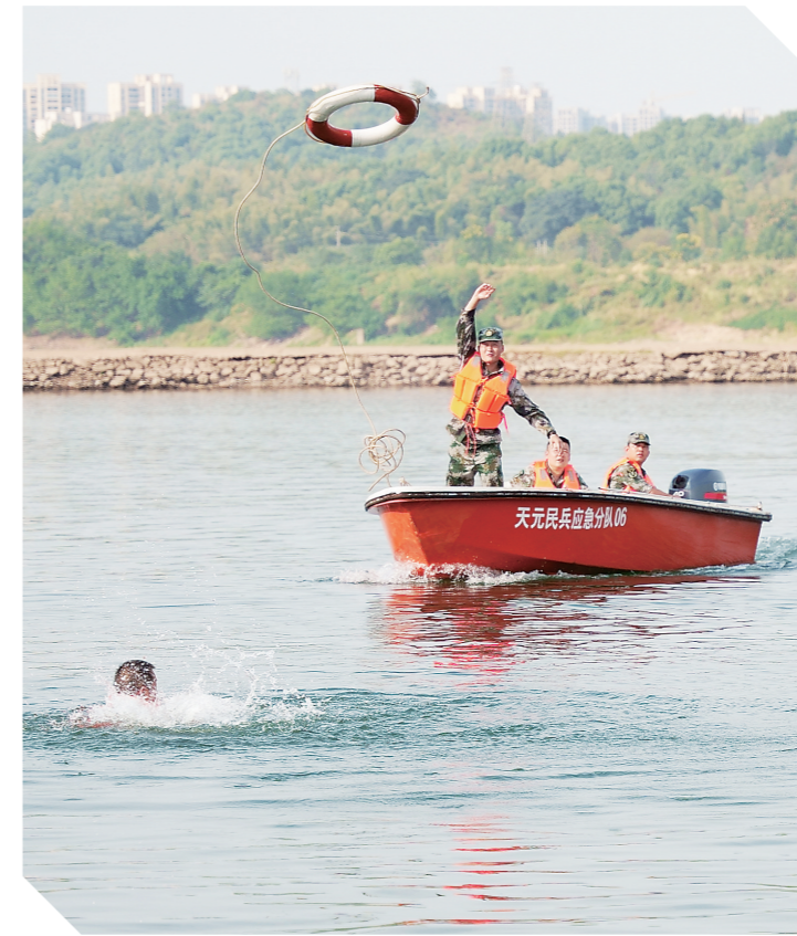
为提升实战能力,9月16日,一场应急救援演练在天元区雷打石镇白沙洲码头打响,共有30名专职消防队员和民兵参加了扑灭模拟油起火、扑灭模拟山火和水上救援等3个项目。图为水上救援演练现场。