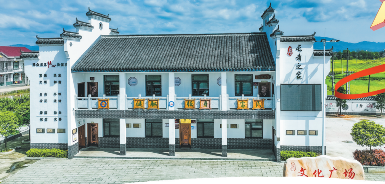
▲联盟街道上云桥村“门前三小”示范点