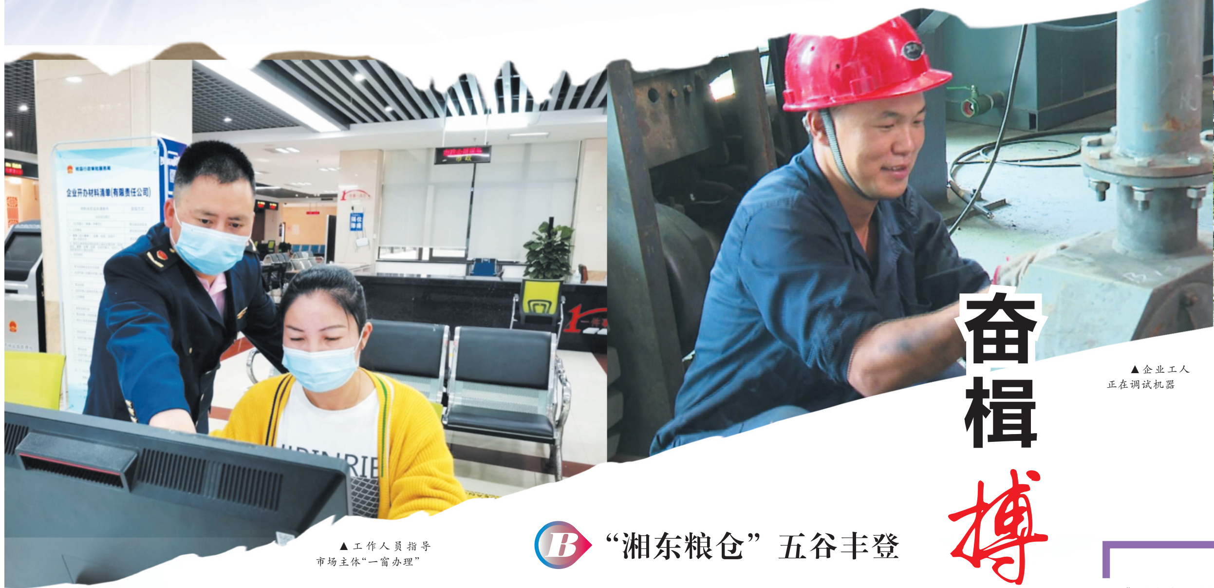
▲企业工人正在调试机器