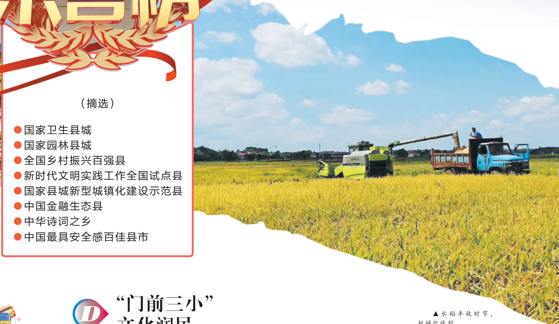
▲水稻丰收时节,机械化收割