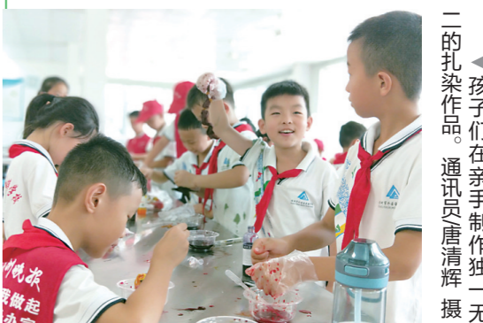
▲孩子们在亲手制作独一无二的扎染作品。

本报讯(株洲晚报融媒体通讯员/唐清辉)9月7日,株洲日报社校园记者俱乐部在荷塘区外国语学校开展非遗进校园活动,该校校园记者在校园内体验国家级非物质文化遗产“扎染”技艺。