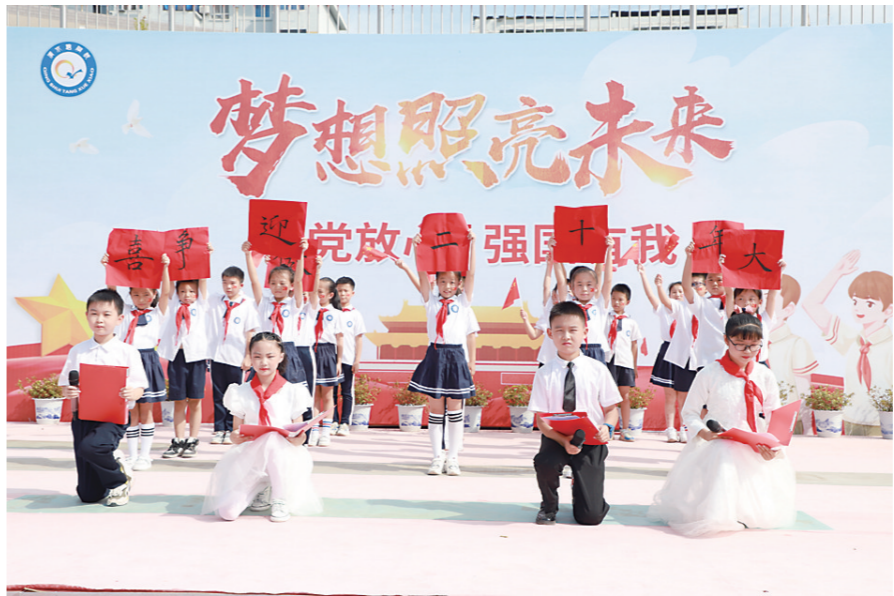
▲开学主题活动上,学生表演节目。

本报讯(株洲晚报融媒体通讯员/王紫裳)校园记者激情朗诵诗歌《我是中国人》后,合唱《强国少年》的高亢之声把仪式推向高潮……9月9日,石峰区清水塘学校举办以“喜迎二十大 争做好少年”为主题的系列活动。