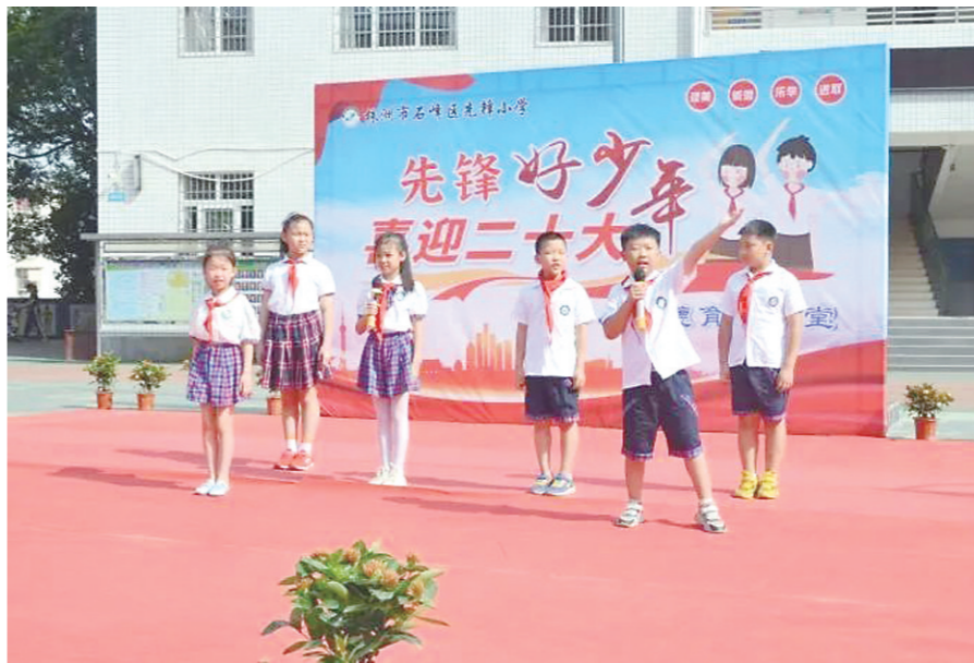
▲先锋小学学生在激情表演。

本报讯(株洲晚报融媒体通讯员/林琳)迎接党的二十大胜利召开,激励和引导少先队员感恩、听党话、跟党走,厚植爱党爱国、爱家爱校情怀。9月9日,石峰区先锋小学开展“先锋好少年 喜迎二十大”德育大课堂活动。