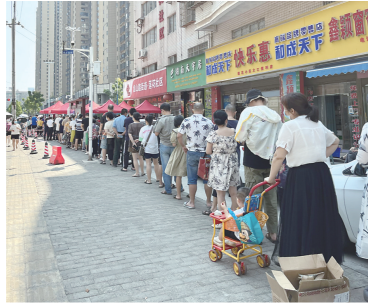
▲一核酸检测采样点,市民有序排队,但“一米线”缺失。

本报讯(株洲晚报融媒体记者/刘平)目前,常态化核酸检测已在城区启动,将持续到10月31日,要求株洲城区及醴陵市、攸县、茶陵县、炎陵县县城常住人口每7天要完成一次核酸检测。9月15日,本报记者走访城区一些核酸检测采样点发现,排队市民很多,场地有限,条件简陋,但排队市民自觉性高,志愿服务很暖心。