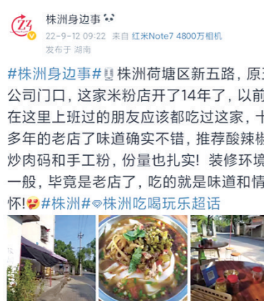
#株洲身边事# 株洲荷塘区新五路, 原五公司门口, 这家米粉店开了14年了, 以前在这里上班过的朋友应该都吃过这家, 十多年的老店了味道确实不错, 推荐酸辣炒肉码和手工粉, 份量也扎实!