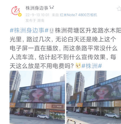
#株洲身边事# 株洲荷塘区升龙路水木阳光里, 路过几次, 无论白天还是晚上这个电子屏一直在播放, 而这条路平常没什么人车流, 估计起不到什么宣传效果, 每天这么放是不用电费吗?