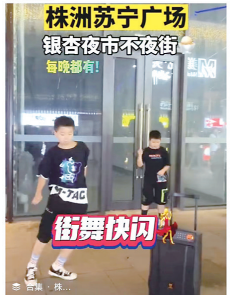
株洲苏宁广场银杏夜市不夜街

株洲发布 22-9-13 18:12 来自 iPhone客户端 【#株洲苏宁广场银杏夜市#】正式开街啦! 网红美食、创意手作、清爽饮品.....每晚都有, 快一起去打卡吧! #株洲发布的微博视频