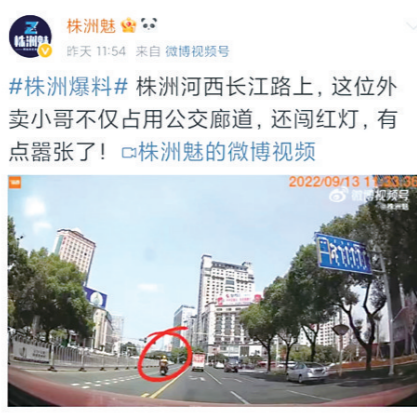
#株洲爆料# 株洲河西长江路上, 这位外卖小哥不仅占用公交通道, 还闯红灯, 有点嚣张了!