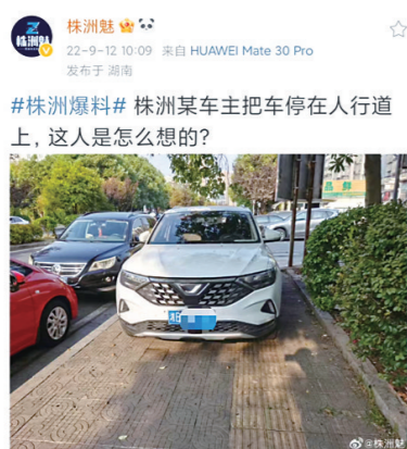
#株洲爆料# 株洲某车主把车停在人行道上, 这人是怎么想的?