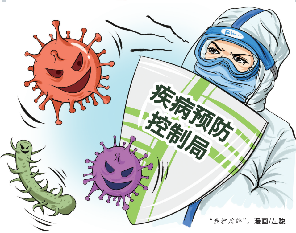
“疾控盾牌”。漫画/左骏