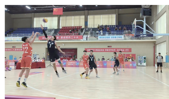
▲株洲男子三人篮球队创造历史,获得省运会该项目男子首金。

四年一届的湖南省运动会正在洞庭湖畔的岳阳如火如荼地进行,1150名株洲健儿分赴岳阳市的各个赛场,用奋勇拼搏的精神,让这个季节显得分外精彩。省运会是运动员们传递激情和梦想、展示勇气和力量的赛场,更是抒写奋斗和团结的舞台。在这座伴水而生、因水而兴的岳阳城,株洲健儿们正在用拼搏与汗水书写着一个个追梦故事。