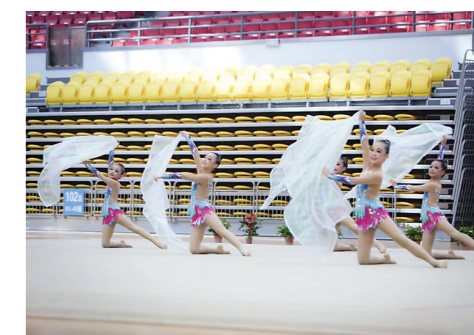
▲株洲艺术体操队赛场上翩翩起舞。市少儿体校供图