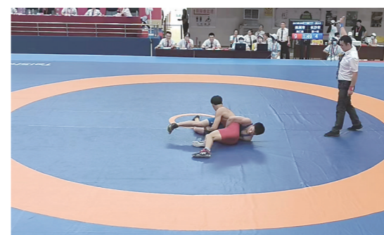
▲株洲摔跤小将(红方)在赛场上奋勇拼搏。