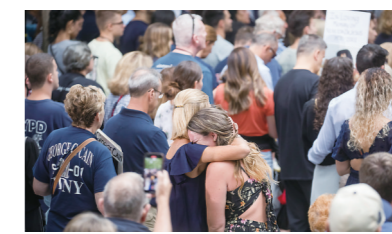
▲当地时间9月11日,人们在美国纽约参加“9·11”事件21周年纪念活动。