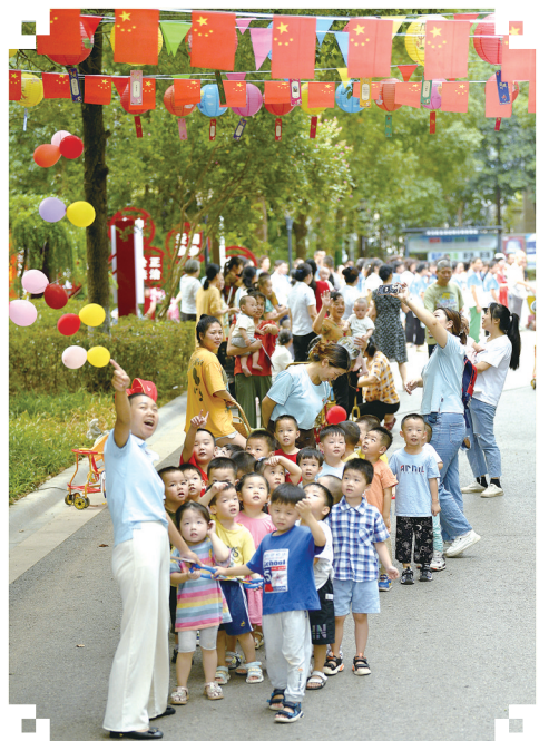
天元区文家冲社区的中秋猜灯谜活动吸引了辖区众多小朋友们参加。

炎陵县红军标语博物馆在中秋之际开展红色故事宣讲活动,给游客讲述红色故事,让旅客在景区内感受红色文化,重温革命历程,缅怀艰难岁月。