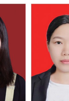
株洲雅礼实验学校 阳高