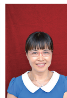
建宁实验中学 文智