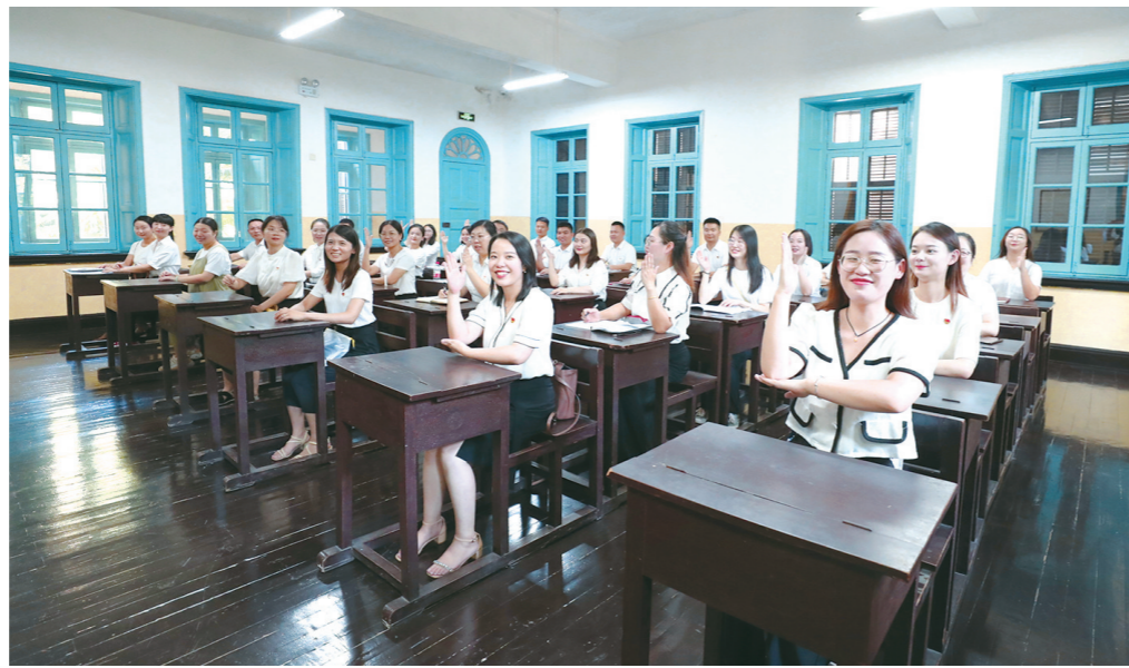
天元区教育系统“行知计划”后备干部培训现场。