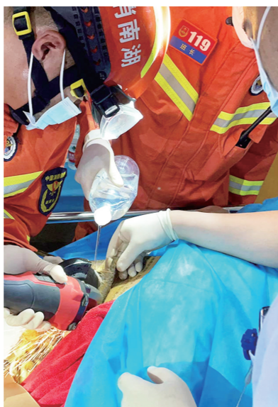
▲消防员在小心切割插入患者大腿的铁耙。

本报讯(株洲晚报融媒体中心记者/马文章 通讯员/陈佳)近日,醴陵消防救援大队江源站接到一通特殊的求救电话:一名患者被铁耙插入大腿,导致医护人员无法进行手术。