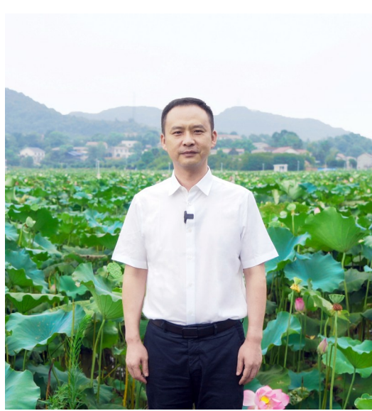
荷塘区委书记方靖。