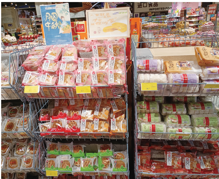
市区多个商超里,多种月饼上市,价格亲民。

曾几何时,市面上高价月饼并不少见。但是,9月7日,记者在走访多个商超后发现,今年的月饼无论是包装还是价格,都是“轻装”上市,其食品属性正逐渐回归。