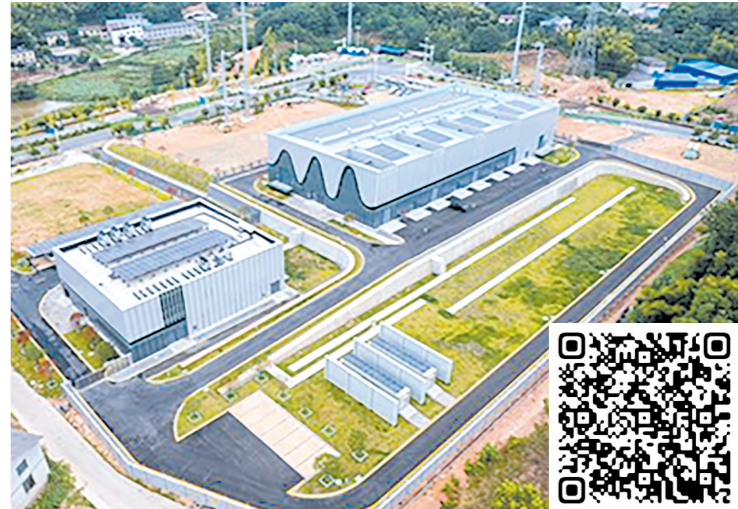
株洲成家(白关)220千伏智慧能源站。

8月31日, 国内首座220千伏智慧能源站——株洲成家(白关)220千伏智慧能源站正式投产。其在变电站基础上, 融合建设数据中心站、交直流微网、充电桩、光伏站、5G通信基站等, 构建“能源流、数据流、业务流”三流合一的一体化运营平台。