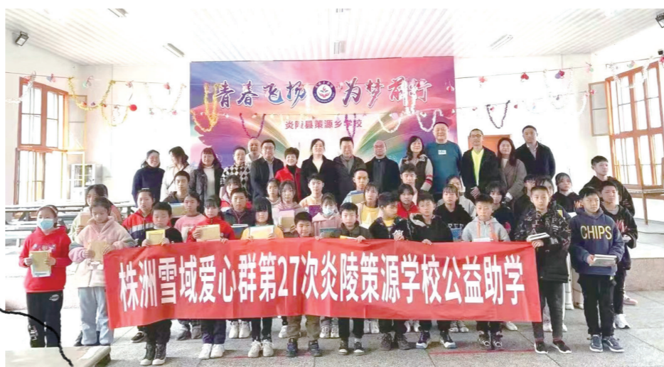
株洲雪峰爱心助学群第27次赴策源学校开展助学时的合影。