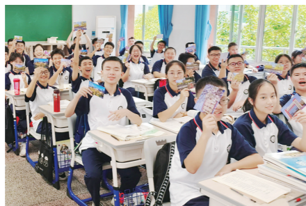
▲ 开学第一天,市八中收到老师或学长手写的明信片。

▲ 开学第一天,市八中收到老师或学长手写的明信片。 本报讯(株洲晚报融媒体记者/戴凇 通讯员/钟芳杰)9月1日,迎着初升的晨曦,市八中举行了庄严而隆重的升旗仪式,伴着雄壮的国歌声,五星红旗冉冉升起。 开学典礼上,市八中校长罗奇发表题为《让青春翻涌出无穷的力量》的讲话,他祝愿同学们在新学期有新气象,在梦航园里体验成长与奋斗的乐趣。祝愿老师们潜心育人,在教育探索与实践收获更多的美好和幸福。祝愿大美八中不负期待,再创辉煌。 方寸寄心语,纸短情却长。据了解,开学前,该校精心组织了“青春寄语”征集活动,定制的八中校园美景明信片上,老师和学长学姐将最真挚的祝福手写赠送给全校每位学子。一张张青春明信片,一