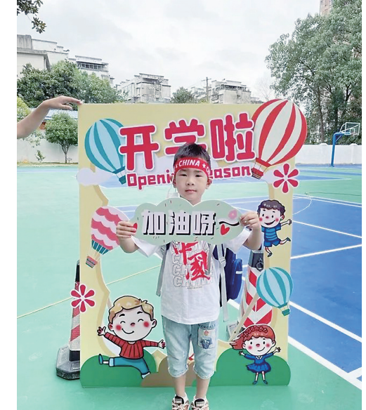
▲芦淞区莲塘小学的同学,新学期为自己加油。

充满童趣的游戏帮助孩子们认识班级,认识老师和新同学,认识校园交通线,学会文明行走等日常行为规范。“你是独一无二的花朵,愿你在校园里自由绽放!”一字一句都是老师对孩子们最美好的祝愿。新学期,新气象,新校园,但愿莘莘学子带着新的希望,以梦为马,不负韶华。