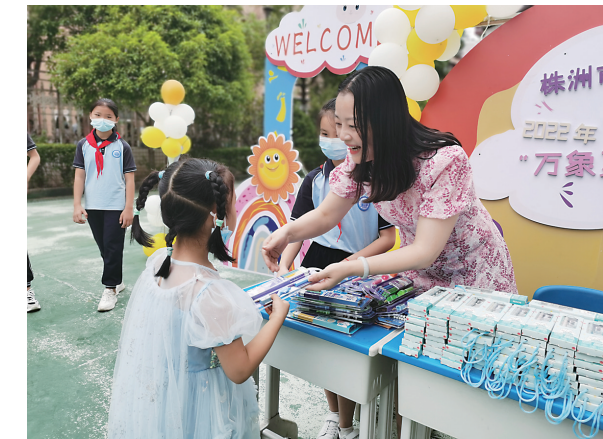
▲开学当天,淞口区明德小学老师为学生发入学礼包。