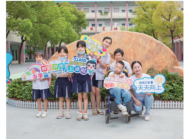
▲石峰区北星小学老师在校门前迎接出行不便的学生。