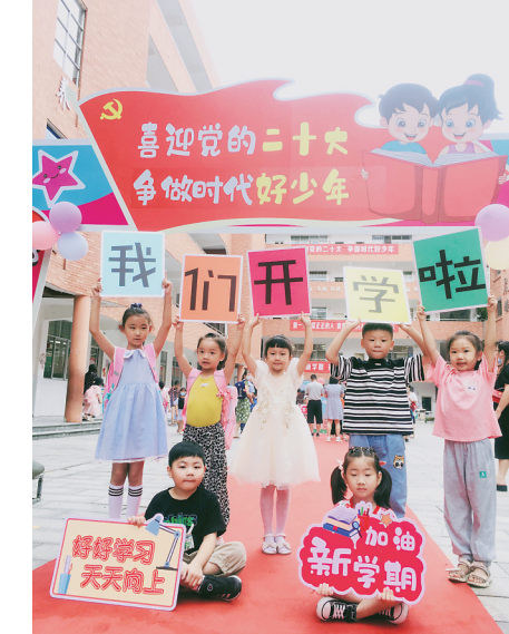
▲“我们开学啦!”荷塘小学的孩子们迎来开学。