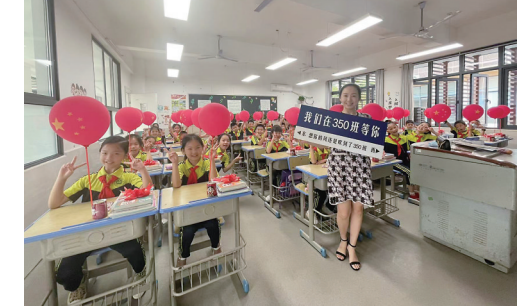
▲仪式感满满,荷塘区六〇一中英文小学为孩子们准备了开学礼包。