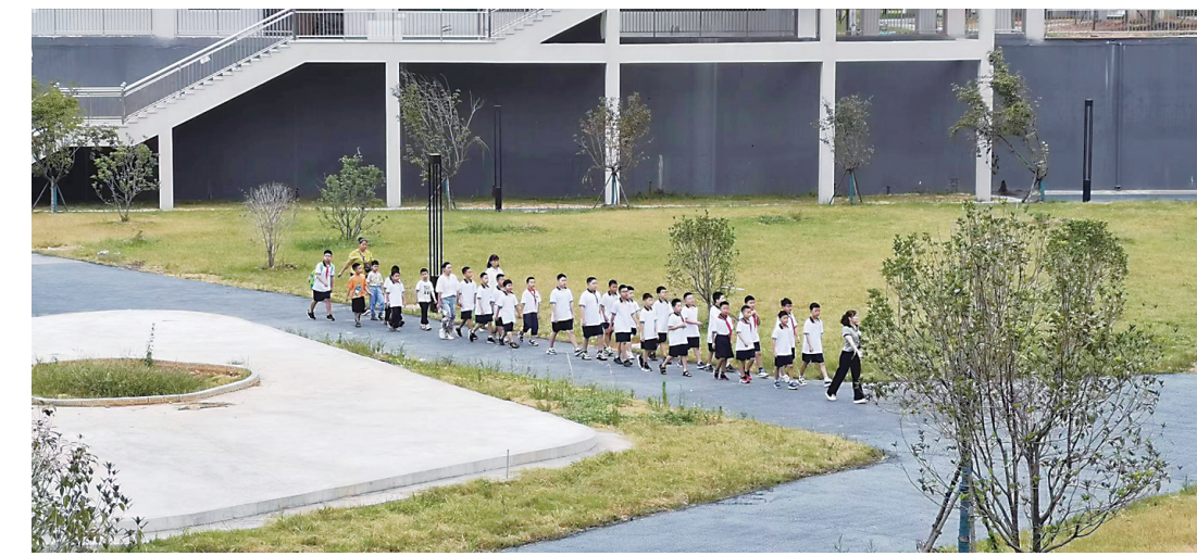
▲开学首日,市二中枫溪学校小学部的学生们在老师的带领下熟悉校园。