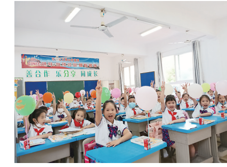
▲石峰区先锋小学的小伙伴们,开心迎接新学期。