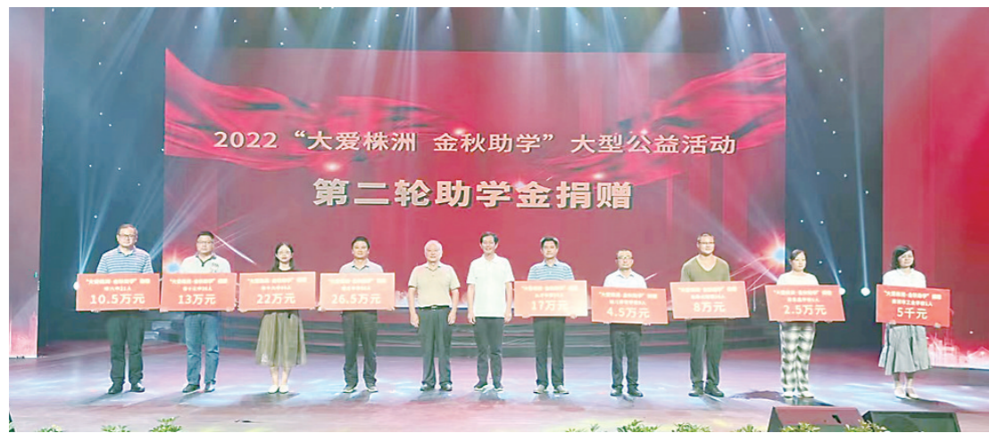
2022“大爱株洲 金秋助学”大型公益活动