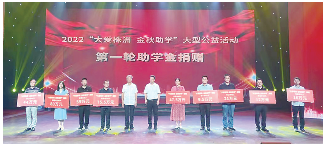
2022“大爱株洲 金秋助学”大型公益活动