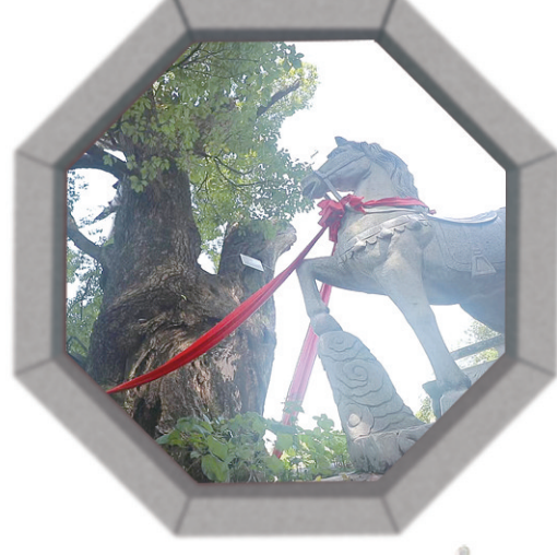
被称为拴马桩的千年古樟。