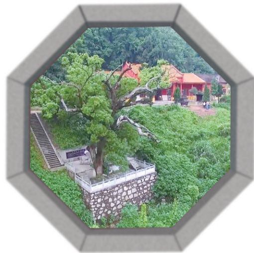
朱亭镇南狮子岭上的祖师殿和千年古樟。