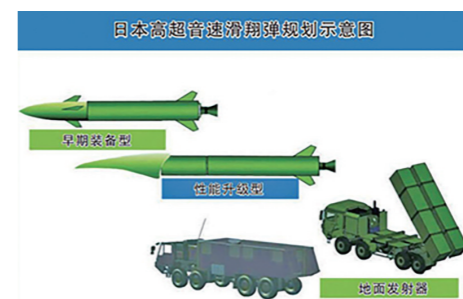
日本高超音速滑翔弹规划示意图

其中,高超音速巡航导弹使用超燃冲压发动机推进,体积和尺寸较小,适合飞机平台发射,计划2030年列装。高超音速滑翔弹则采用助推-滑翔设计,由地面发射器发射,飞至大气层边缘,滑翔体与火箭助推器分离,在卫星和惯性导航系统引导下高速滑行,从目标正上方俯冲攻击。针对高超音速滑翔弹,日本防卫省制定了两个阶段的研究