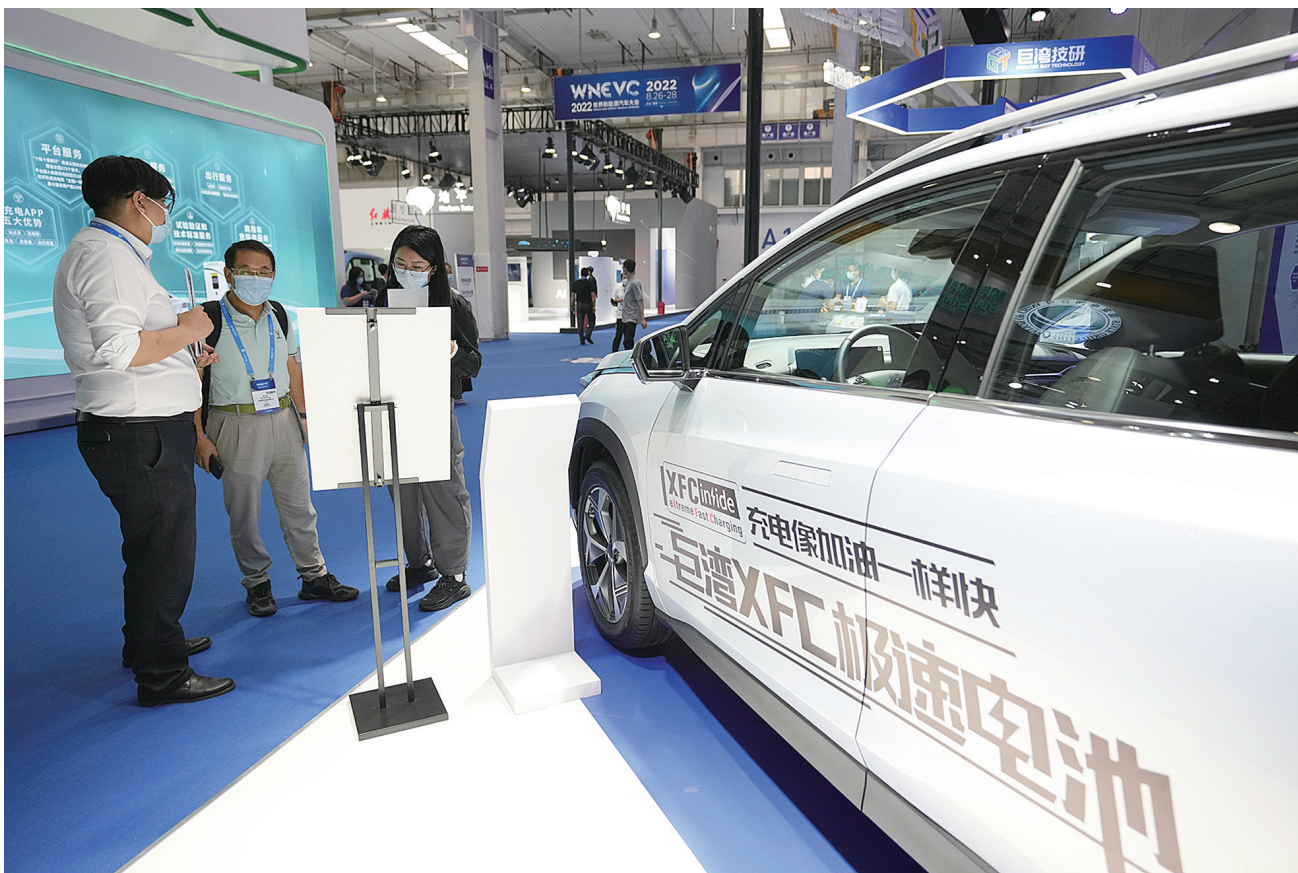
8月26日，工作人员向参观者介绍一款搭载可快速充电电池的新能源汽车。

新华社北京8月27日电 2022世界新能源汽车大会27日在北京开幕。本届大会以“碳中和愿景下的全面电动化与全球合作”为主题，邀请全球政产学研界代表共商进一步加强全球绿色低碳合作与交流，促进全产业链融合贯通，加速突破新能源汽车全面市场化障碍。