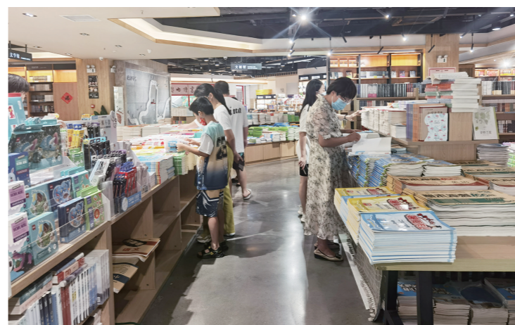
▲学生和家购买教辅资料。