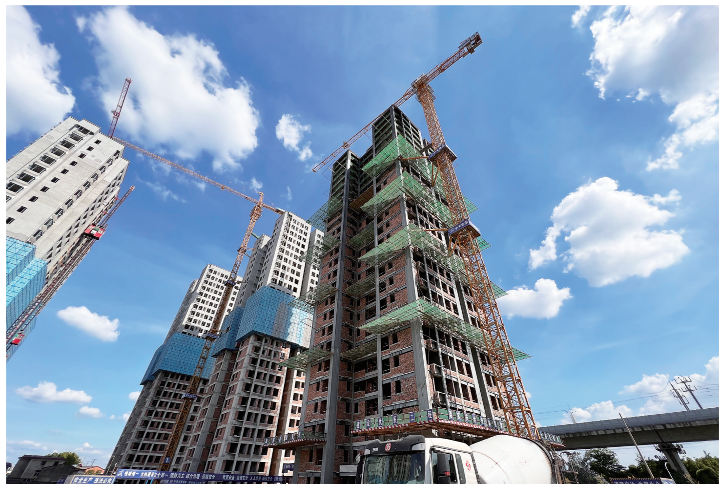
▲株洲首栋钢结构装配式廉租房提前封顶,这栋楼有26层,共208户。