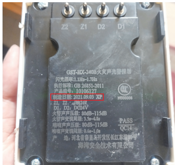
▲火灾声光报警器制造日期为2021年9月3日。

本报讯(株州晚报融媒体中心记者/廖智勇)物业专项维修资金是住房物业公共设施的维修储备金,维修资金如何使用与业主利益息息相关。近日,天元区钻石怡园业主易哥向晚报热线 28829110 投诉:小区业委会涉嫌违规使用物业专项维修资金。