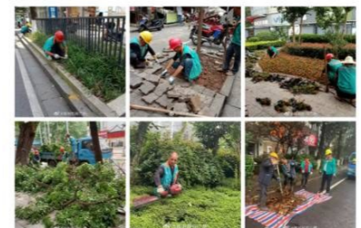
友善评论,文明发言

株洲新闻广播 2小时前 来自 微博 weibo.com #1012第一资讯# 【芦淞区园林绿化中心:创文路上风云】 自今年4月初启动创文“百日攻坚”行动以来,历时136天,芦淞绿化人始终保持“战斗”状态,用闯的精神、创的劲头、干的作风筑起了城市美丽的风景线...全文