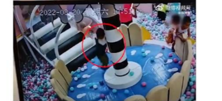
点赞是美德,转发是鼓励

株洲爆料 22-8-24 09:19 来自 微博视频号 发布于 湖南 #株洲爆料# 【株洲一男童被游乐场中突出铁片划破头皮#游乐场:第一时间维护维修】据@热点新闻 报道:8月20日,株洲网哪一男童在游乐场玩耍时,被一突出铁片划破头皮,家长质疑游乐场安保工作不到位。#游乐场回应男童被铁片划破头皮#。对此,游乐场工作人员回应称,确实是游乐场的责任,第一时间已经联系维修人员排查维修,目前还未就赔偿事宜与家长达成一致。@株洲爆料的微博视频