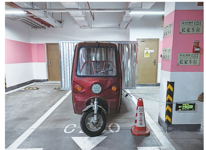
▲湘水湾小区四期,车位的铁皮箱的三轮车被锁在水泥柱上。