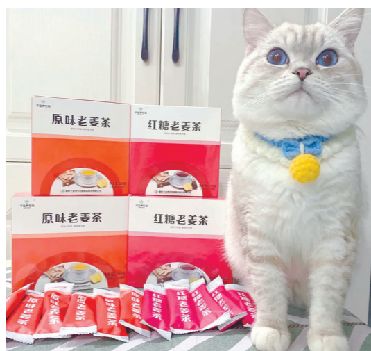
作品名称：本猫为千金代言 作品描述：大眼睛喵来站台，红糖姜茶真不错。 作者：千金养生坊、千金瑰秘药业 陈智渊