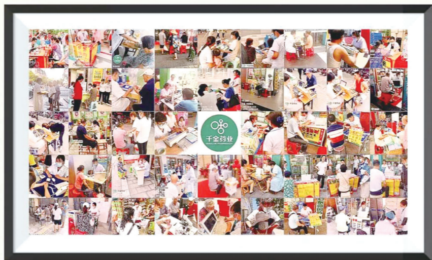
作品名称：40℃的坚守 作品描述：一群在工作中最帅最靓的千金营销人。 作者：千金药业 李剑

工作中，生活里，旅途间，有很多瞬间值得记录，有很多故事可以分享……近日，千金集团团委以“记录快乐，定格甜蜜”为主题，面向全集团青年开展了一次摄影大赛。活动一经推出，260余名青年踊跃参与，共征集到400余幅（组）摄影作品。本刊编辑从400余幅（组）摄影作品中精选出如下数幅（组），让我们一起来透过光影，分享千金人的精彩瞬间。