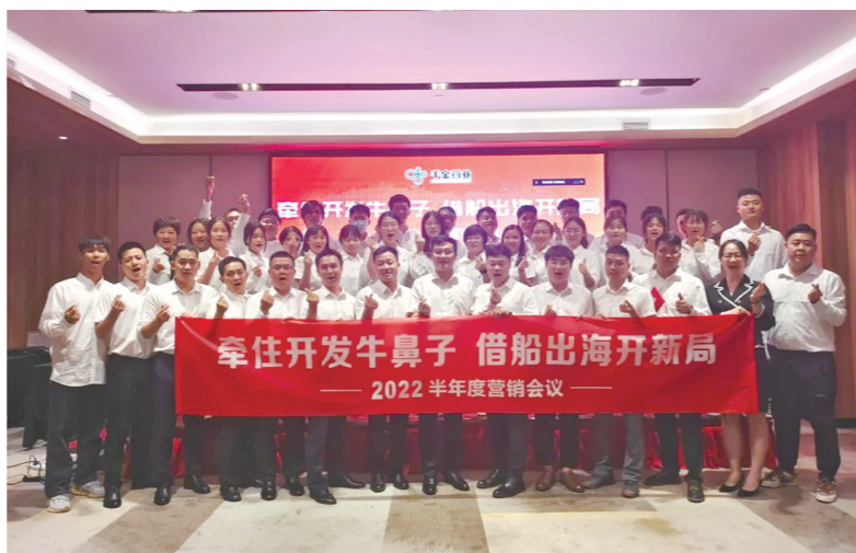
作品名称：“高”“大”“尚”的千金人 作品描述：一群人，一条心，一起干，一定赢。 作者：千金药业 张传乐