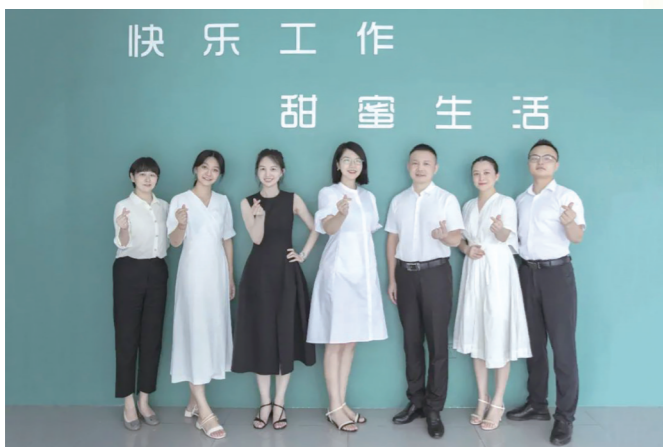
作品名称：快乐甜蜜的团队 作品描述：大美人生，千金可期。 作者：千金药业 王聪