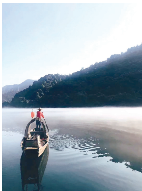
作品名称：雾漫小东江 作品描述：云雾茫茫，轻舟载梦。 作者：千金药业 李嘉欣