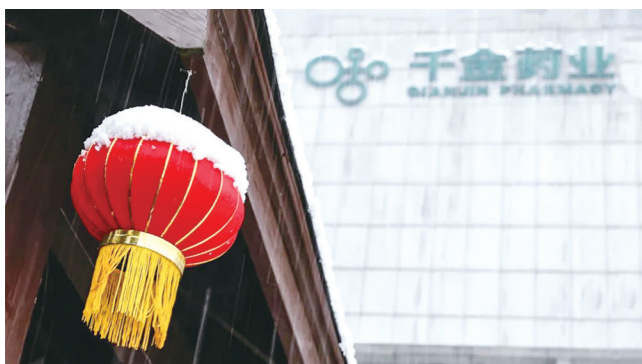
作品名称：瑞雪兆千金 作品描述：雪后，那绵绵的白雪装饰着千金，琼枝玉叶，粉妆玉砌，景色喜人。 作者：千金药业 兰铮