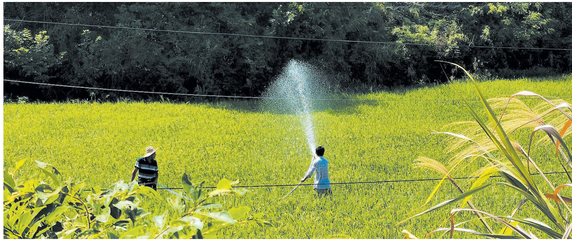
群丰镇竹溪社区,洒水车开到田间给水稻“降雨”。

连日来,群丰镇镇领导干部下沉到各自包片社区,现场协调解决抗旱工作困难,社区做好居民安抚工作,调动居民群众协同抗旱;在保障居民正常生活饮水的同时,合理调用抗旱设备,降低受灾面积,降低农户损失。