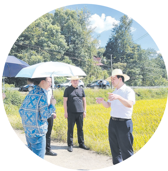
▲市应急管理局党委书记、局长颜文明在浏口区调研抗旱工作。

8月20日上午,浏口消防救援大队接到南洲镇南山村村民的求助电话,求助内容很简单,只有一句话:“能不能帮我们送点水来?”