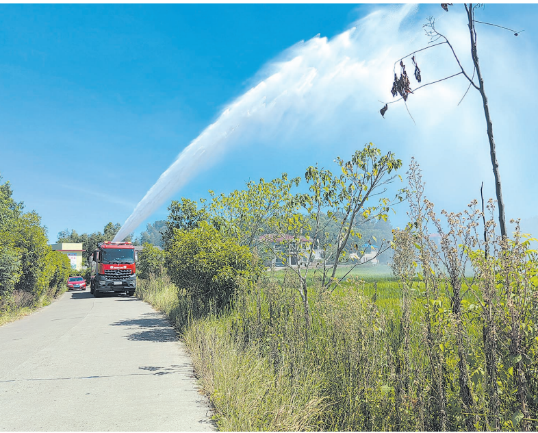
消防车对干涸的农田送来“及时水”。马文章 摄

后,水罐车内的10吨水见底了,车辆立即开回消防站,储满水后再次返回田间,继续灌溉作业。经过2个多小时的灌溉,农田终于“解渴”。