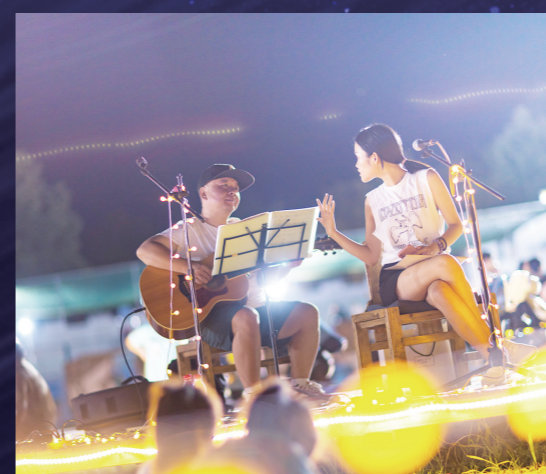
▲夜幕下,有人唱起了民谣。

8月20日,当夜幕降临,在荷野公社大草坪的浪漫星空下,萤光点点,凉风徐徐,晚报红娘举行的相亲交友活动正在这儿甜蜜上演。