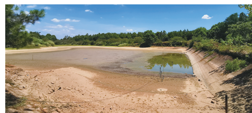
易胡承包的鱼塘只剩一汪浑水。

最近,醴陵市东富镇东富村村民易胡遇到了难事:一边是自己放养的4吨鱼苗,需要充足的水源救命;一边是下游600多亩农田,需要抽水灌溉保苗。作为村里的产业发展带头人,他毅然决定打开闸门,将水放至最低位,又架起设备抽排,4吨的鱼苗因此变成“鱼干”。