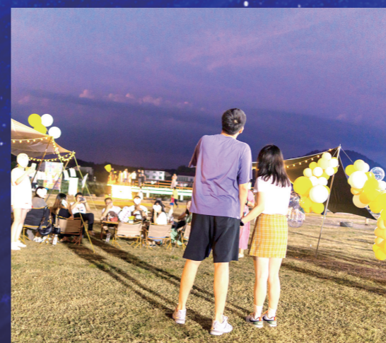
▲游戏环节接受“惩罚”,这对嘉宾现场走秀。