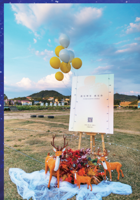
▲一切准备就绪,活动即将开始。