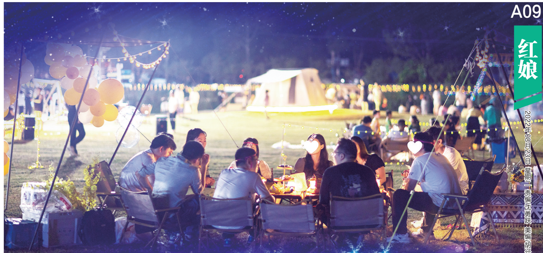
▲晚风徐徐,聊聊天、做个游戏,真韵味!