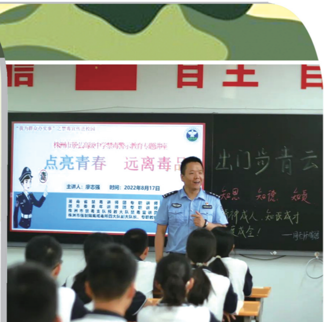
▲禁毒警示教育专题讲座。

炎炎夏日,高温难耐,但开学的脚步不停歇。景弘高级中学从人性关怀的角度出发,从提升学生核心素养的角度考虑,为学生设计了丰富多彩的入学教育,这份给予学生从身体到心灵洗礼的“沁人心脾套餐”,也成为了家长口中的“五星好评”入学套餐。