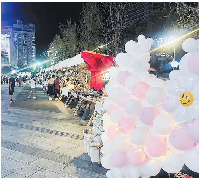
株洲计划通过“微亮化”拉动夜间经济。