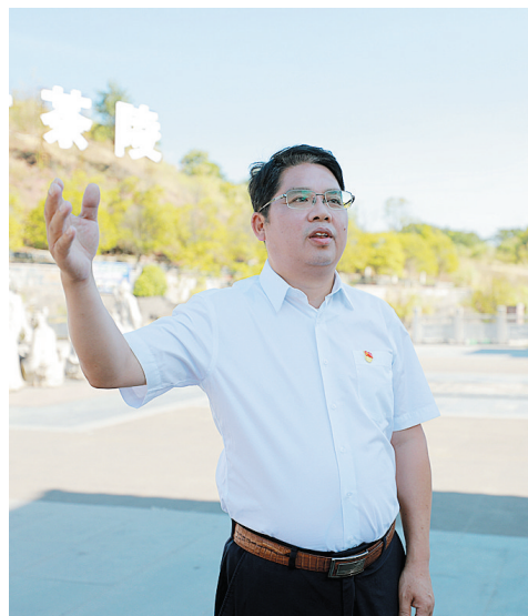
茶陵县委书记邓元连。