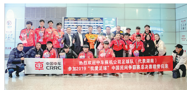
▲2019年, 中车株机足球队获中国足协“我爱足球”民间争霸赛全国总决赛季军, 公司专程欢迎。

株洲田心, 被誉为“中国电力机车的摇篮”, 其实也是一片飞扬绿茵梦想的沃土。这片沃土上, 株机足球队见证株洲足球发展的跌宕起伏, 也凭借过硬实力成长为中国职工足坛的一支劲旅。