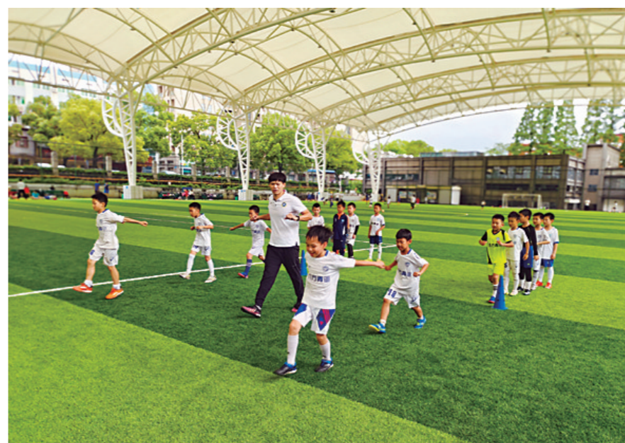
▲中车株机足球队的队员在带孩子们进行集训。

傍晚, 田心足球场, 中车株机足球队的队员化身教练, 带着中小学生们集训。列队、奔跑、踢球, 孩子们挥洒汗水, 也充满欢笑。