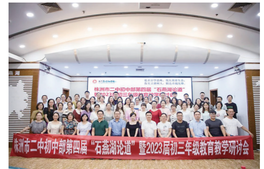
▲研讨会教师合影。