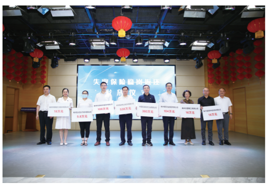
6月15日,全市稳岗促就业服务专窗开通暨失业保险稳岗返还发放仪式现场。

株洲日报全媒体记者/何春林 通讯员/彭韶蓉 近日,省人社厅传来消息:今年上半年,我省克服疫情冲击、经济下行等因素影响,从“降、缓、返、补、提”5方面打造减负稳就业政策体系,为企业纾困解难,推进稳就业、防失业工作。